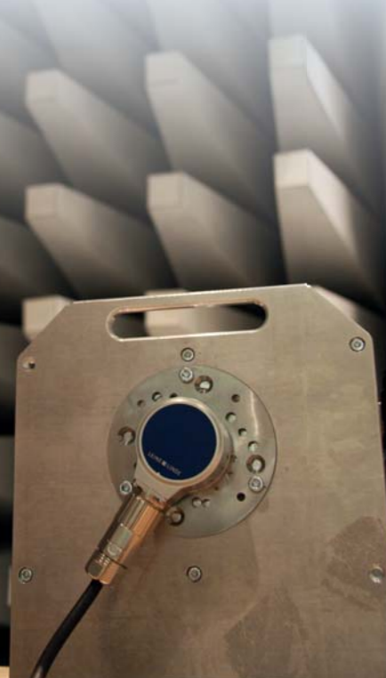
Test an einem neuen Drehgebermodell in DELTAs Labor.

ist ein branchenunabhängiges Beratungsunternehmen, das Lösungen im Bereich Produkt- und Geschäftsentwicklung anbietet. Das Unternehmen zählt 260 Mitarbeiter und unterhält 15 Niederlassungen in Schweden, Norwegen und Dänemark.